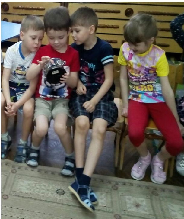
рассматриваем новый экспонат